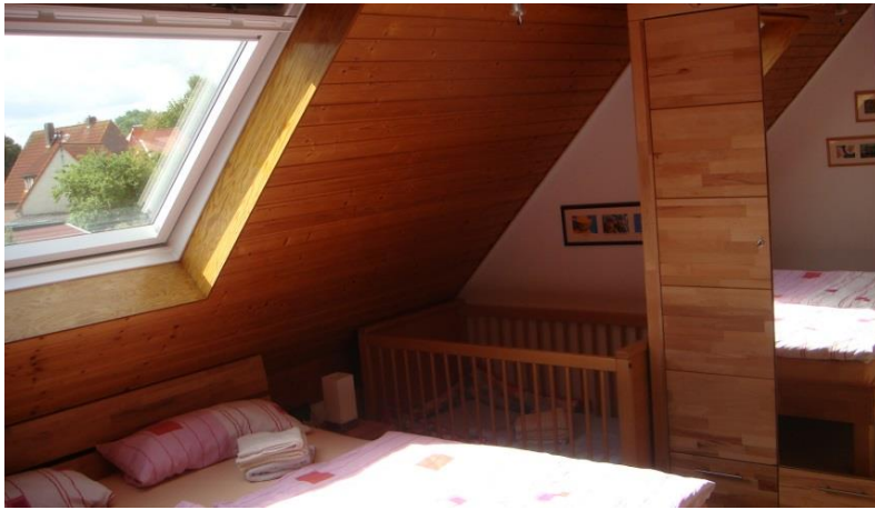
Schlafzimmer 1. Etage