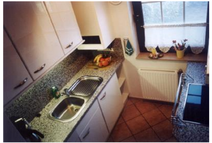
Küche im Erdgeschoss