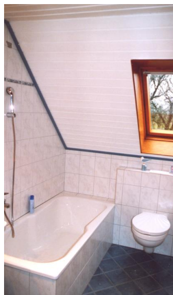
Bad 1. Etage